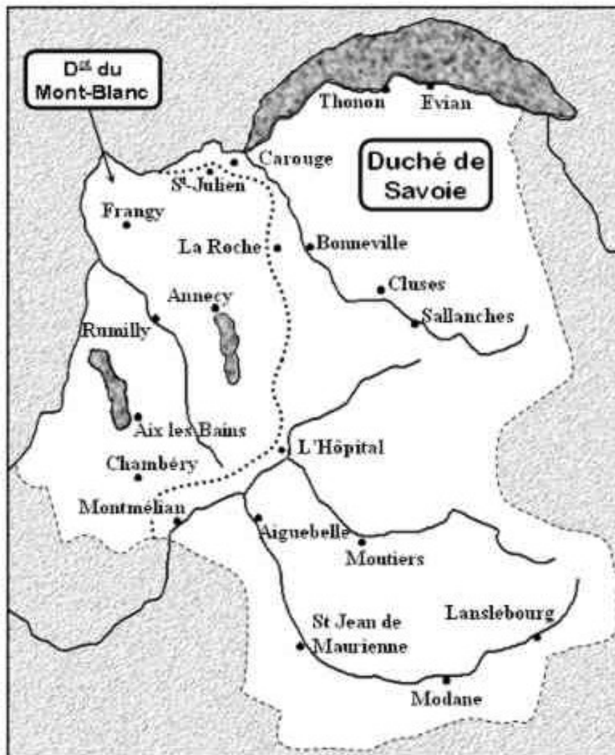
Partage de la Savoie entre l'Etat Sarde et la France au traité de Paris du 30 mai 1814