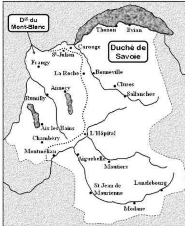
Partage de la Savoie entre l'Etat Sarde et la France au traité de Paris du 30 mai 1814